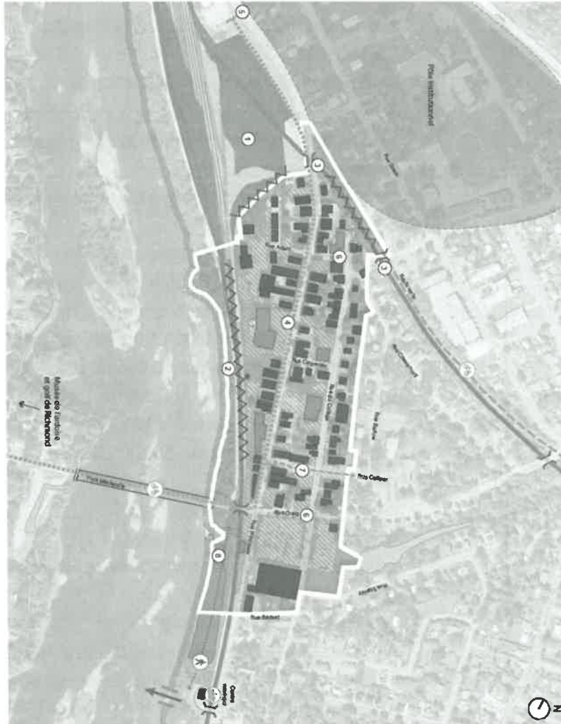
Figure 3 - Carte synthèse