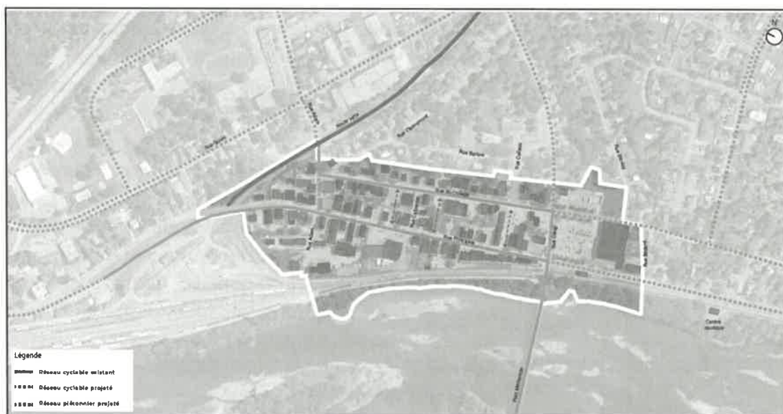
Figure 2 - Limites du territoire d'application du PPU

À la lumière des précédents constats, la mobilité active au centre-ville peut parfois être perçue comme ardue et peu invitante. Néanmoins, la Ville de Richmond a mis beaucoup d'effort dans le domaine du transport actif depuis l'adoption du précédent PPU, notamment avec l'entrée en vigueur de la Politique de transport actif en décembre 2020. Le Plan directeur des transports actifs adopté est ambitieux et intègre plusieurs éléments portés à accroître vraisemblablement l'accessibilité et les interactions qui convergent au centre-ville. À terme, la mise à exécution des recommandations présentes au plan directeur permettra à coup sûr d'améliorer la sécurité des piétons et des cyclistes et de connecter le centre-ville aux services importants du secteur. Un exemple pouvant témoigner de la portée positive de cette politique est l'insertion de deux traverses piétonnes sur la rue du Collège Nord, soient aux croisements des rues Coiteux et Adam. Cette mesure permet aux usagers d'accéder au noyau du centre-ville par l'est de manière sécuritaire.