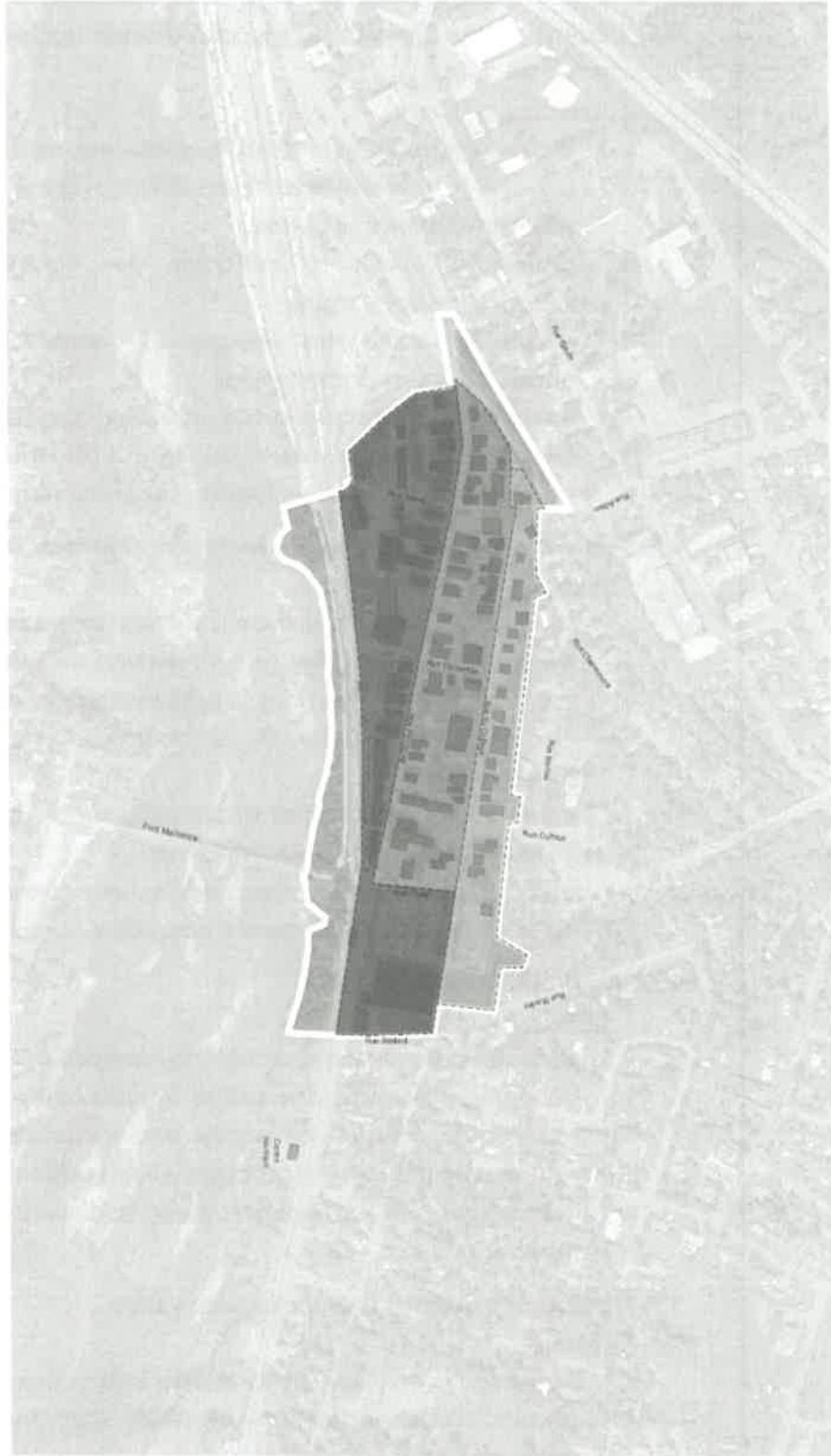
Figure 6 - Plan des hauteurs