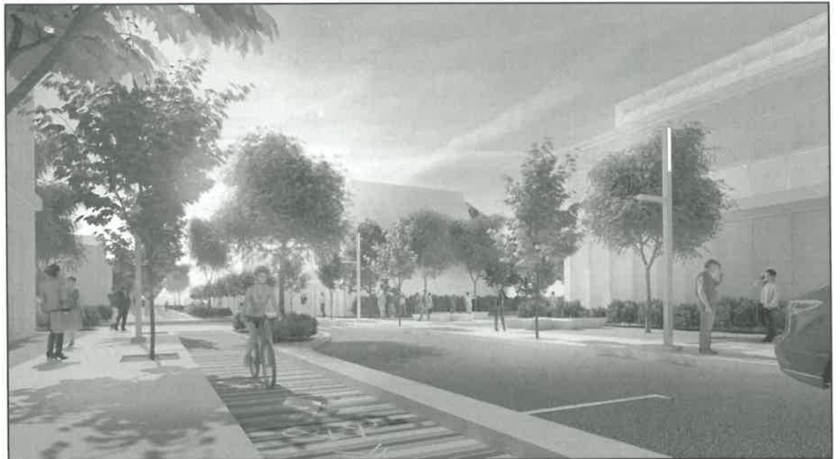
Figure 7 - Image d'ambiance de la rue Principale (à titre indicatif)

Les figures 7 et 8 sont des inspirations de ce que pourrait être la future rue Principale.