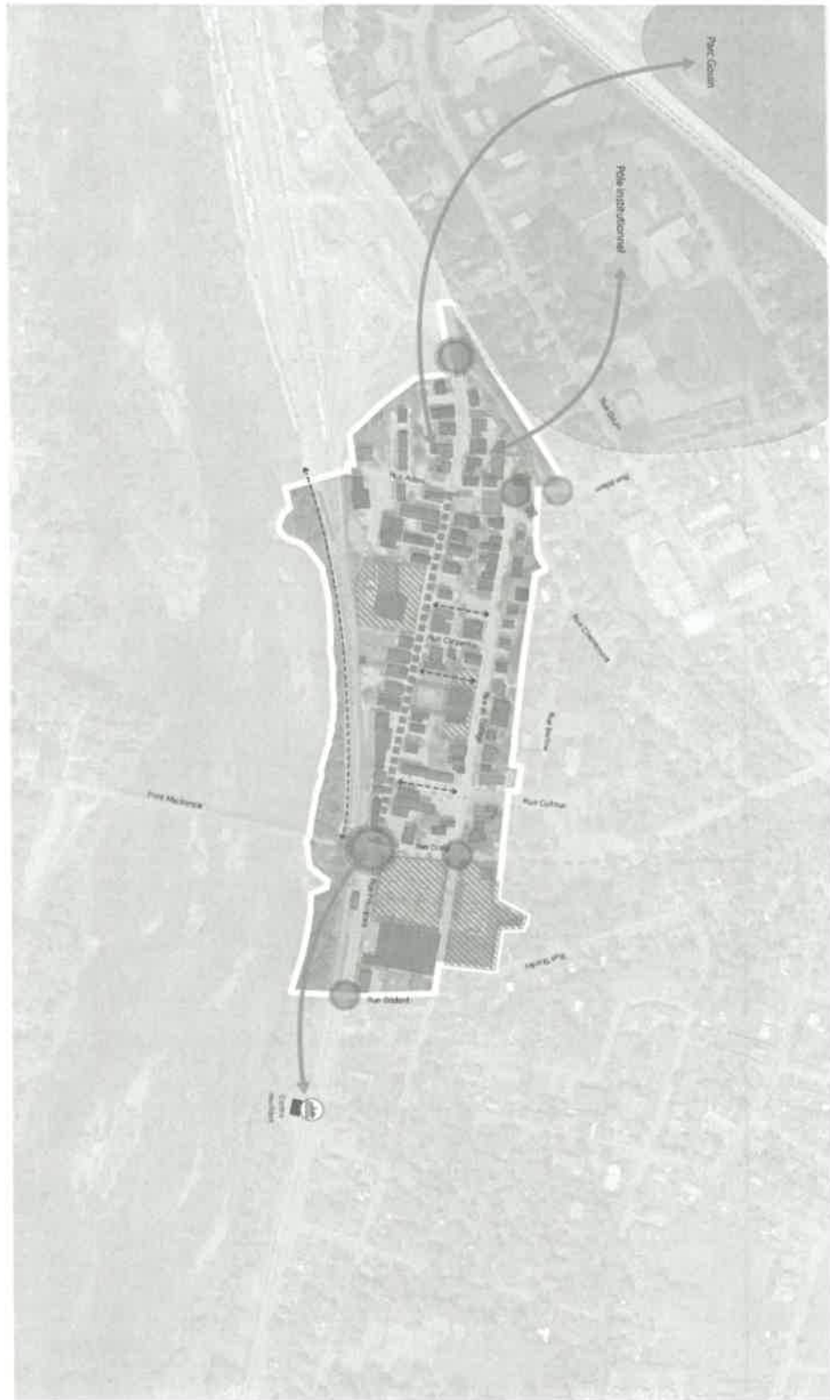
Figure 4 - Plan des affectations du territoire